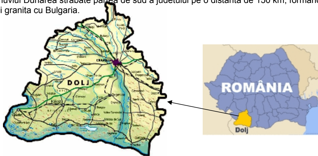
Figura 1. Amplasarea judetului Dolj

Fluviul Dunarea strabate partea de sud a judetului pe o distanta de 150 km, formand totodata si granita cu Bulgaria.